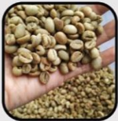
LOW QUALITY GREEN BEAN