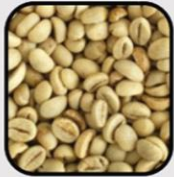
POLISH GREEN BEAN