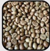
WASHED GREEN BEAN